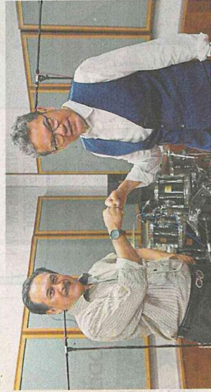
Rukun Negara was composed by Mokhzani (left) while Lima Prinsip Rukun Negara is the work of Wah.

"Songs belonging to the patriotic genre are seasonal in nature and only played during the Merdeka month. This is one of the reasons why most people are unaware of the existence of various patriotic numbers, including the Rukun