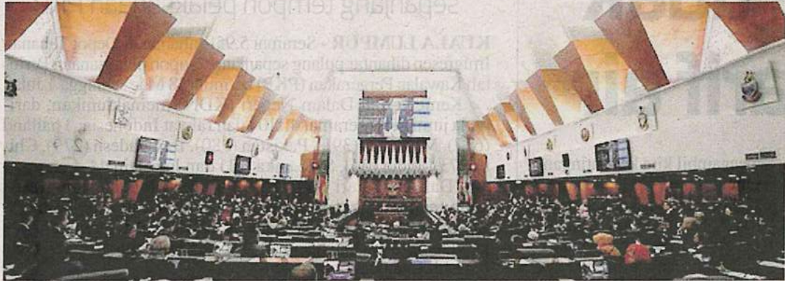
Ahli Parlimen perlu menjaga tutur kata semasa bersidang di Parlimen supaya mereka dihormati rakyat.

Bahasa yang digunakan memperlihatkan identiti orang yang menggunakannya